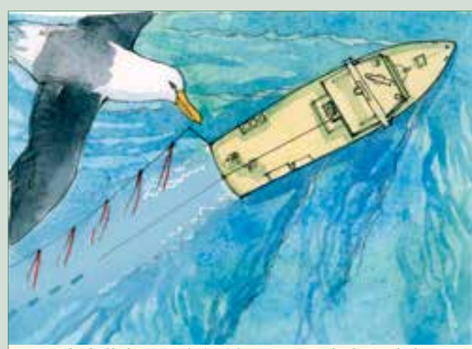
图1. 染成蓝色的鱿鱼饵料融入周围海水环境鸟瞰图

在染色的工序中要求将饵料完全解冻才能便于饵料的充分染色。通常所使用的食品染色剂是 Virginia Dare FD C Blue No. 1 或 E133。巴西一家专门生产食品染色剂的公司 Mix Industria 已经开发出一款专门用于对渔业中饵料进行染色的产品。根据染料浓度和不同种类的颜色, 饵料浸染