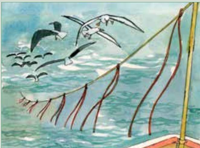
图1 彩色飘带阻止海鸟觅食饵料

有效地使用单一彩色飘带的关键是在空中延伸的范围、调节彩色飘带位置的能力、飘带距离海面的高度（>7米）及总长度（150米）。飘带的间距、长度及制作飘带所使用的材料也是要重点考虑的。