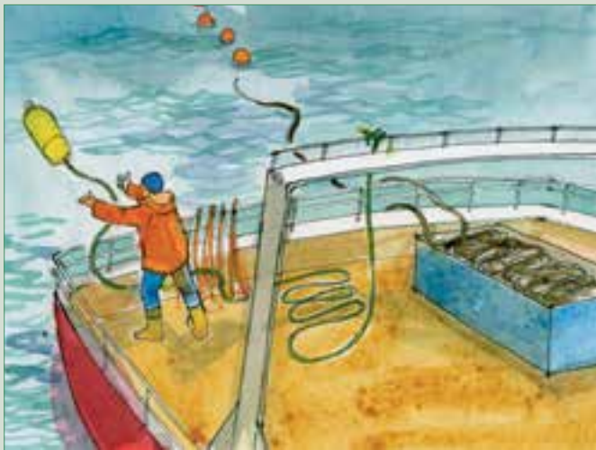
图2 彩色飘带应该在第一枚钓钩离开船之前放好